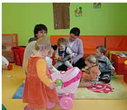
Espace-jeux à PLUMAUGAT 11.03.08

✓ Espaces-jeux du Relais : Les espaces-jeux auront lieu jusqu'au 1 er juillet. Voir ci-dessous le planning du Relais