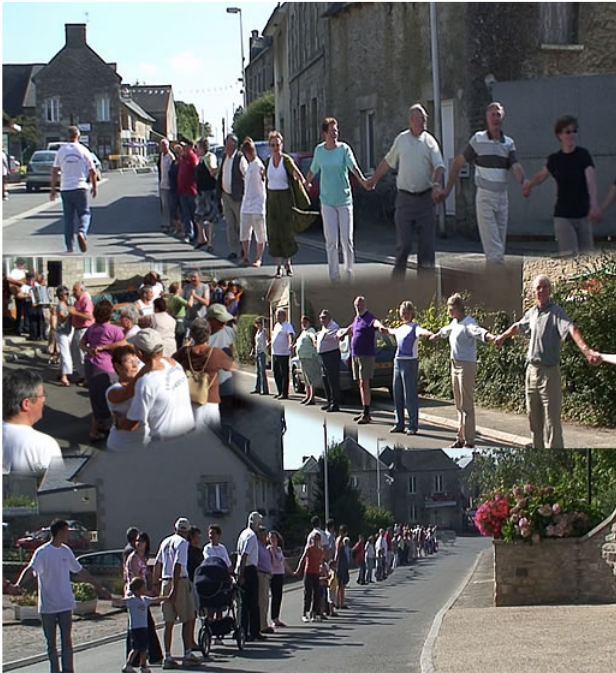
Chaîne de l'amitié