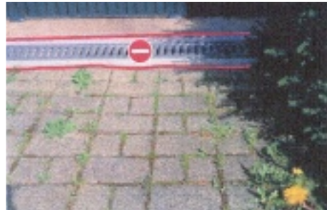
Avaloir au bas d'une pente de garage

Tout traitement sur les caniveaux, avaloirs et bouches d'égoûts est interdit