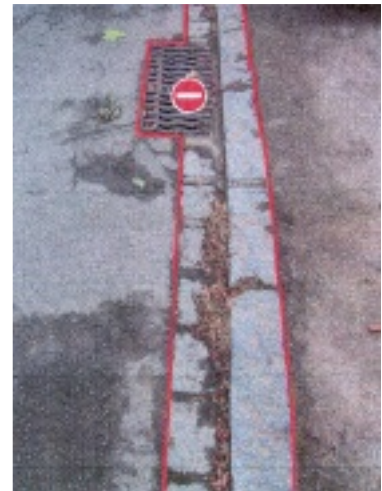
Caniveau avec bouche d'égoût

Tout traitement sur les caniveaux, avaloirs et bouches d'égoûts est interdit