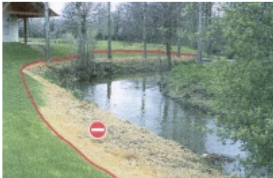
Bord de rivière

Tout traitement à moins de cinq mètres des berges d'un cours d'eau, canal ou point d'eau est interdit