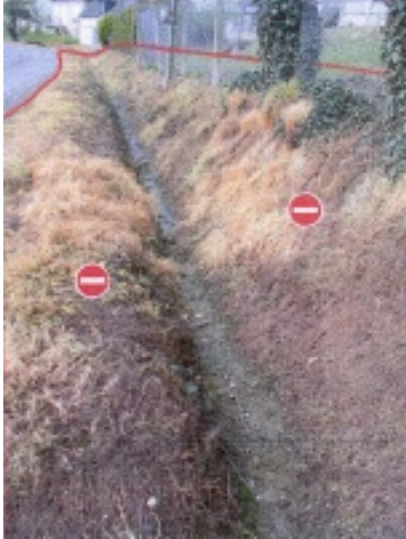
Fossés avec ou sans eau

Pendant toute l'année, pour tout produit phytosanitaire